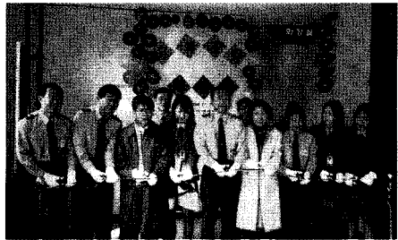
▲ 새롭게 꾸민 화장실 태완 커팅 장면(탄천운전면허 시험장)

서울 강남의 탄천 변에 운전면허 시험장이 있다. 기존의 화장실이 너무 낡아서 리모델링을 하려고 하는데 의견을 듣고 싶다는 전갈이 왔다.