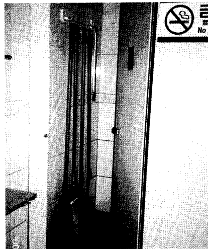
▲정소용품을 정리하여 놓은 비품실이 따로 설치되어 있다.

앞으로 2002 월드컵, 아시안게임, U대회 등 국제적인 행사가 있는 만큼 우리나라 국민들도 이번 기회에 화장실문화의 꽃을 피울 수 있도록 사용자의 의식수준을 한 단계 높이는 계기가 되었으면 한다.