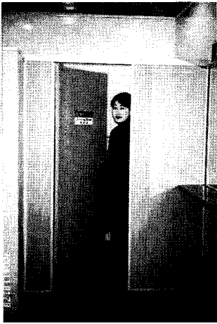
◀동대구역을 찾은 시민이 Dressing Room을 사용하고 있다. ▼여자화장실 내부에 설치된 Dressing Room