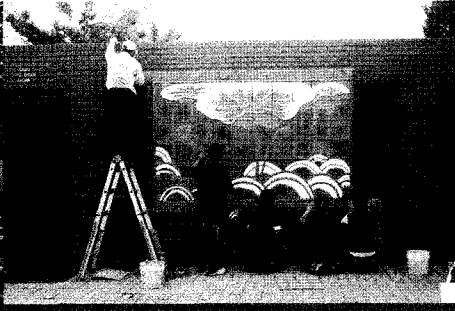
▼아름답게 변한 화장실 ▼연꽃무늬로 만든 전돌을 부착하는 화장실문화 바꾸기팀

다음 화장실 목표는 덕진공원이었다. 전주시 덕진공원은 4만5천 평의 호반을 낀 휴식처로서 연꽃으로도 아주 유명하다. 그 곳에서 만난 화장실 또한 상반된 화장실이 두 개가 놓여있었다. 우린 이 곳에서 많은 고심을 하였다.