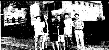
▲전주대장석수 교수와 자원 봉사자들

미소공을 만들면서 '아름다운 화장실을 만나는 것보다 더한 즐거움이 있다.' 면 그것은 아마도 아름다운 마음씨를 갖고 주어진 여건 속에서 최선을 다하여 화장실문화를 변화시키는 사람들을 만날 때였을 것이다.