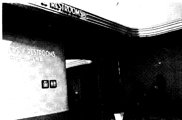
▲ 오오사카KUSJ 오스토메이트 전용 화장실의 외관

한편, 장애자들이 보다 쉽게 사회활동에 참여할 수 있게 하자는 것이 국제적인 추세로 일본에서는 '하트빌딩법'과 '복지를 생각하는 마치즈쿠리 조례' 외에도 '교통 배리어후리법' 시행에 따라 휠체어사용자 등 장애자에 대한 「공공시설의 장벽해소」를 지향하는 '배리어후리(Barrier free)'화를 국가나 지방자치단체에서 추진하고 있다. 덕분에 공공 화장실뿐만 아니라 민간의 사무실빌딩 곳곳에 장애자 전용 화장실