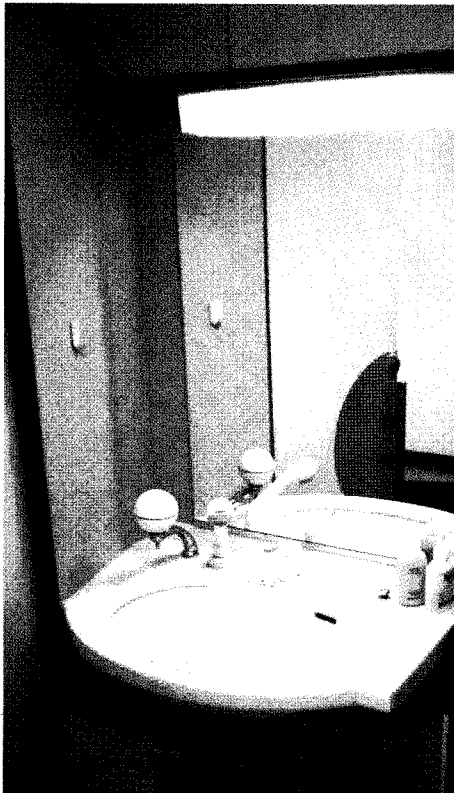
◀ 온수용 샤워기를 설치한 세면대