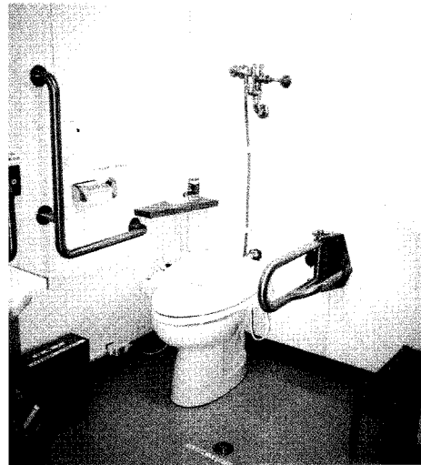
▲ 나리시노시 시청 본청사 내의 오스토메이트 전용 화장실내부 /사진 왼쪽의 세면기아래에 급수설비가 있다. 왼쪽에 흑크가 있다. /사진 왼쪽 아래가 휴지통, 오른쪽 아래가 의복교환용 화물대로서 그 위에도 선반이 있다. 흑크도 2개 장소에 부착되어 있다

노동안전위생법상에서도 노동자생활의 권리로서 오스토메이트들이 사용할 수 있는 화장실의 완비는 필요하다. 오스토메이트전용 화장실의 신설이 무리라면 하다못해 장애자용 화장실에 급탕설비와 온수용샤워기, 흑크, 발로 밟는 개폐식 휴지통만이라도 설치되어야 한다. 기성제품으로도 그런대로 충분히 사용할 수 있으므로 수십만엔(₩)정도의 투자만으로 설비가 가능하다. 이런 정도의 노력조차 할 수 없다면 장애자를 위한 배리어후리화에 대한 해결책은 없다고 할 수 밖에 없다.