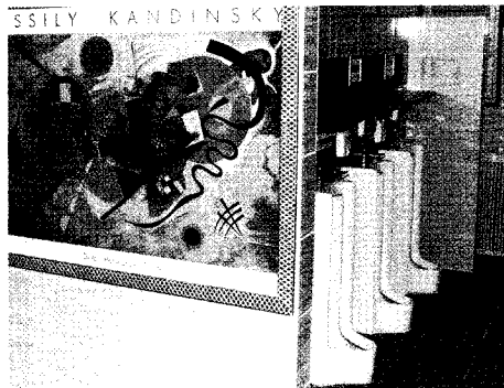
▲ 대구 망우공원의 공중화장실

선진공중화장실 견학(구·군담당자등 30명), 전국 우수화장실 사진 및 관련용품 전시회개최(3회), 화장실 문화개선 발표회등을 개최하여 화장실 문화 개선의 필요성에 대한 분위기 조성을 하였고 「공중화장실 일제정비 관계관 회의 개최」등으로 체계적인 계획과 「공중화장실 환경개선 보완지침」을 시달하여