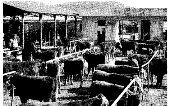
[그림 1] 경매대기우 사진