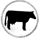
표2. 우유 내 표준평판계산, Clostridia 아포, 옥도잔유에 대한 착유 전 유두준비효과