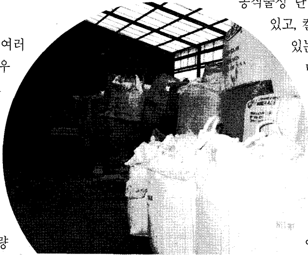
▲유기성부산물은 종류도 다양하고 성분도 다양하기 때문에 이용가능한 종류를 선별하고 외부의 대학, 연구소, 사료회사 등에 분석을 의뢰하여 원료를 효율적으로 사용할 수 있도록 하여야 한다.

또한 영농법인 같은 경우 사료량이 많으면 옥수수 같은 곡물을 직접 배정받아 분쇄하여