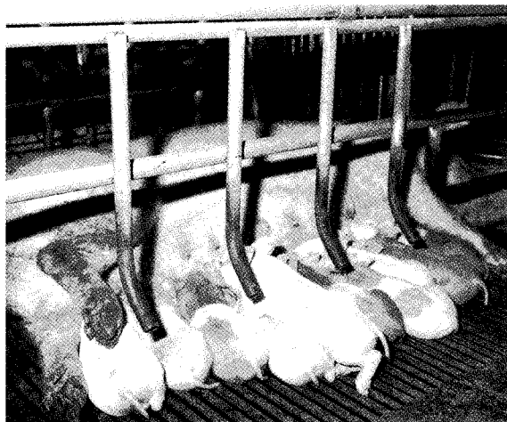
▲ 일반적으로 모돈 도태는 30~40%(평균 35%) 정도이며, 이는 1년동안 초산돈 분만복수 비율의 2배한 수치가 년간 모돈 도태율이 된다.