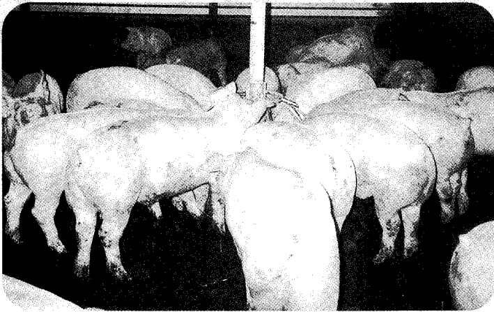
▲성과급 재원을 산출하는 기준은 기업의 업종이나 규모등의 특성에 적합하게 사전에 노사간의 합의에 의해 결정되고 그 합의된 약속이 투명한 경영을 통해 지켜질 때 성과급의 효과는 증대될 것이다.

이 특정의 비용절감이나 생산의 증가에 제한되지 않고 경영의 최종목표인 이윤을 기준으로 하기 때문에 복합적인 성격을 갖는다.