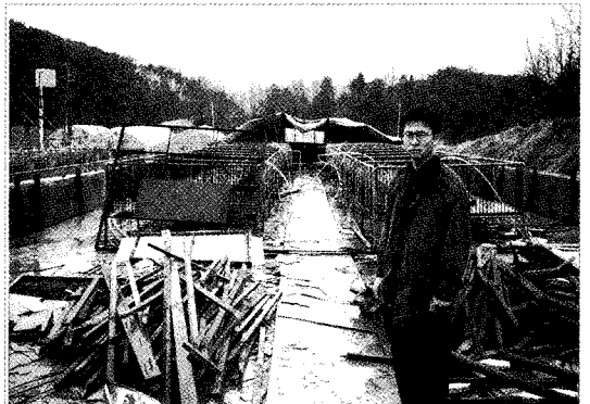
▲ 강원도 횡성 고속도로 공사로 인한 피해를 입은 농장의 폐쇄

이에 대하여 피신청인은 신청인 농장주변을 중점관리 대상지역으로 선정하고 공사소음을 50~54dB(A)로 유지하여 건설공사장 소음규제기준인 70dB(A)이하가 되도록 관리하여 왔으며, 농장과 발파공사 현장과의 거리는 약 260~430m로서 절토사면이 방음벽 역할을