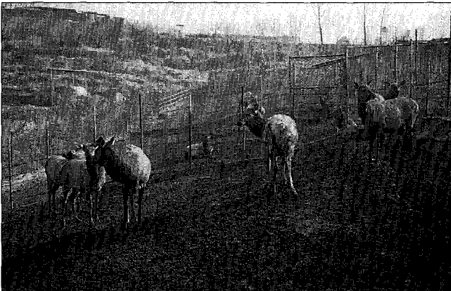
▲ 암사슴은 겨울철 임신상태이므로 다양한 조사료원 확보가 필요하다

겨울철 동안은 임신의 초기상태로 커다란 체중의 변화는 없으며 일반적으로는 조사료 위주의 사양관리가 바람직하겠으나 월동용 조사료원이 같았 하나뿐일 때에는 농후사료의 급여 비율을 과비가 되지 않을 정도로 늘려주는 것이 경제적인 면에서 유리하며 조사료의 여건에 따라서 농후사료의 급여 수준을 정해야 한다. 될 수 있는 한 조사료