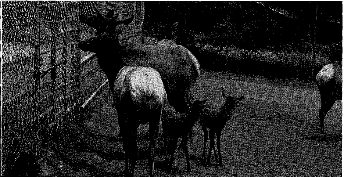
▲ 늦새끼 분만은 경제적인 손실로 이어지므로 적기에 자육이 태어날 수 있도록 관리해야 한다

한편 12월이 지나 발정이 와서 교배가 되면 자연히 늦새끼를 다음해에 분만하게 되므로 새끼의 사육이 어려워질 뿐 아니라 성장발육이 나빠져 경제적인 손실을 가져옴은