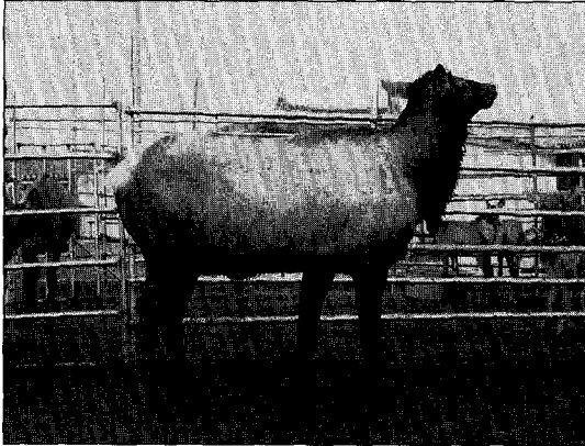
▲ 발정기를 거친 숫사슴은 체력이 상당히 소모된 상태로 영양관리에 신경을 써야한다

발생하며, 다른간에 분리 사육될 경우에도 철망을 사이에 두고 머리를 맞대고 비벼대므로 철망이 뚫리거나 파이프가 넘어가는 사례가 있으므로 항상 시설물을 점검해야 한다. 특히 종축으로 사용하는 사슴은 잘 먹