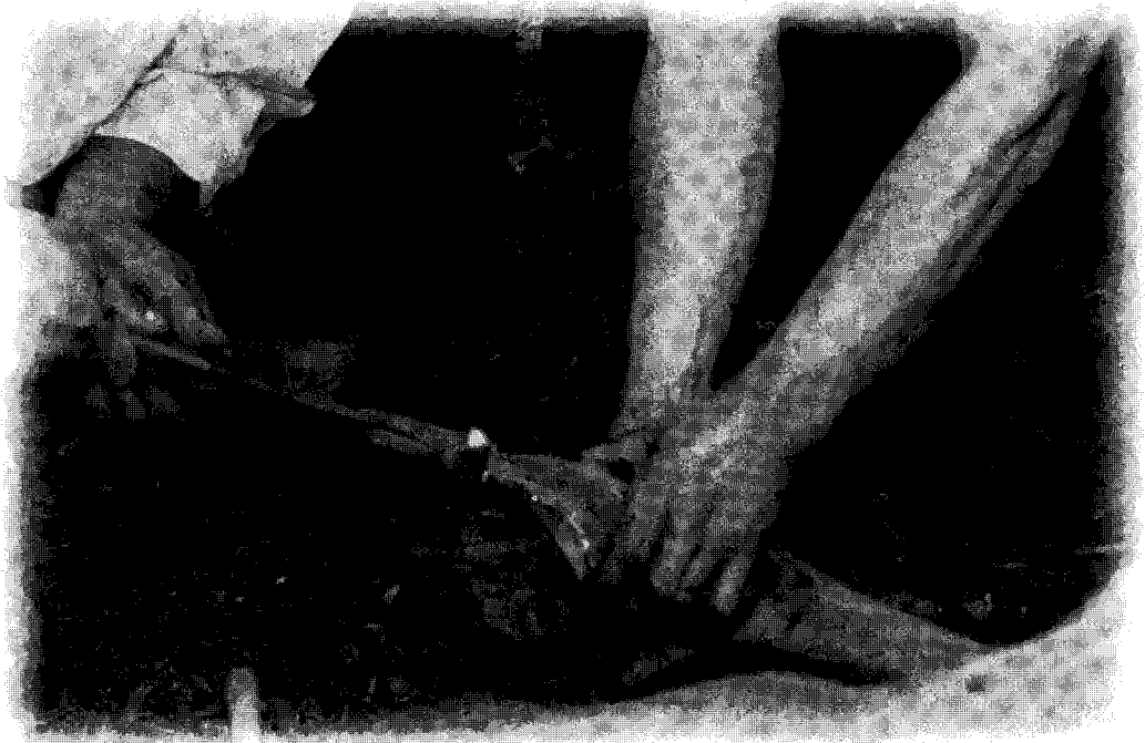
▲ 부제병을 예방하기 위해서는 바닥흙을 1년에 1회정도 교체해 줘야 한다.

지게 되며 이것이 사슴 1두당 차지하는 사육공간이 좁은 우리의 현실에서는 발의 건강을 해치게되는 시발점이 되는 것이다.