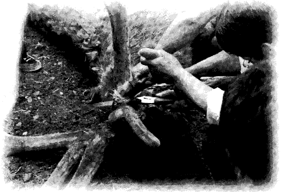
▲ 절각증후군을 예방하기 위해서는 절각 전후 세심한 관리를 필요로 한다.

료와 조사료의 급여조절로 비만 관리가 되어야 한다. 쉽게 말하면 수사슴의 낙각이 되는 시기부터 암사슴의 비만관리가 이루어지면 순산을 하는데 많은 도움이 된다. 겨울철 내내 먹이던 사료 급여 방식을 분만에 이를 때까지 급여하는 농가를 많이 접해 왔다. 이런 농가는 난산을 역시 높였다.