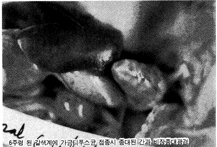
6주령 된 갈색계에 가금티푸스균 접종시 종대된 간과 비장종대광경