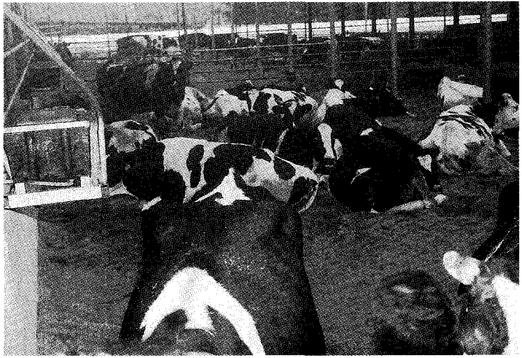
〈주요 유제품 수입 현황〉

분유류(혼합분유 제외)는 수입량의 증가가 현저하게 나타났다. 탈지·전지분유 그리고 조제분유는 전년동기대비 2배이상 증가하였다. 특히 조제분유는 그동안 국내산 분유로 시장이 형성되어 있었으나 금년에는 외국산