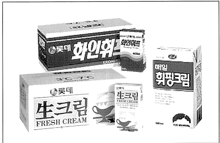
▲ 국내에서 유통 중인 동물성 휘핑크림 제품들.

업체의 한 관계자는 “휘핑크림 시장이 성장을 꾸준히 이어갈 것이라는 의견이 아직까지 지배적인 분위기”라며 “앞으로 업체들의 수입선이 늘어나고 품