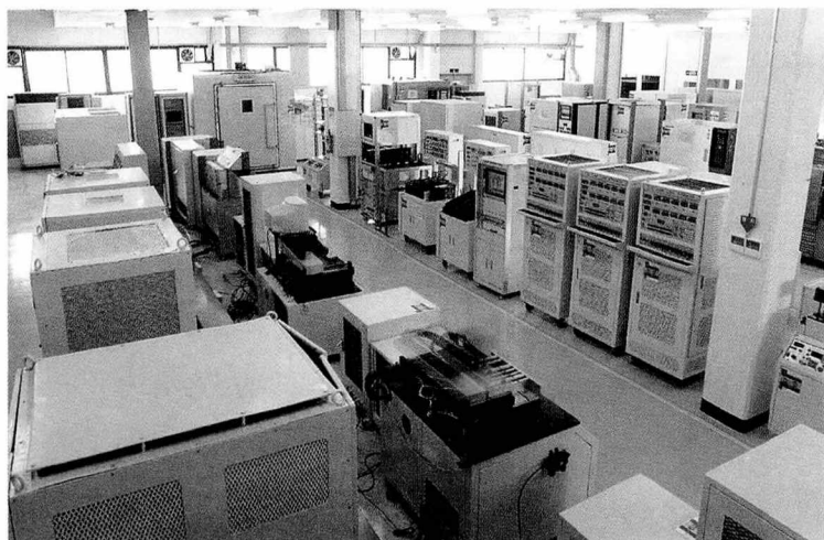
▶ 대성전기(주)의 신뢰성 시험라인 전경

“경기도 안산시 반월 공단내에 위치한 대성전기(주)는 전기, 전자, 자동차 및 정보통신의 핵심부품을 생산 판매하는 종합부품업체로서 항상 고객과 함께 발전한다는 경영철학으로 성장 발전하고 있는 기업이다.”