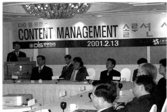
▲ 인터우브 팀사이트 금융권 CIO 초청 세미나 장면