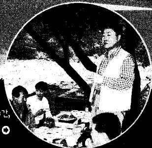
과거 경험으로의 등반코스를 마치고 드디어 식사시간, 호장님! 기념사는 짧게 해주세요. 〇