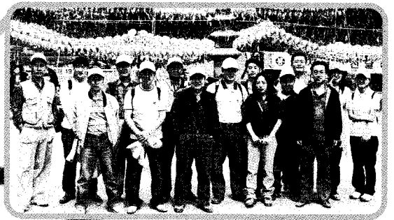
○ 분차임과 함께 연주를 앞두고 연주암에는 연등이 조령조령~ ESCO사업도 결실을 맺어가고 있어 흐뭇해요 *^^*