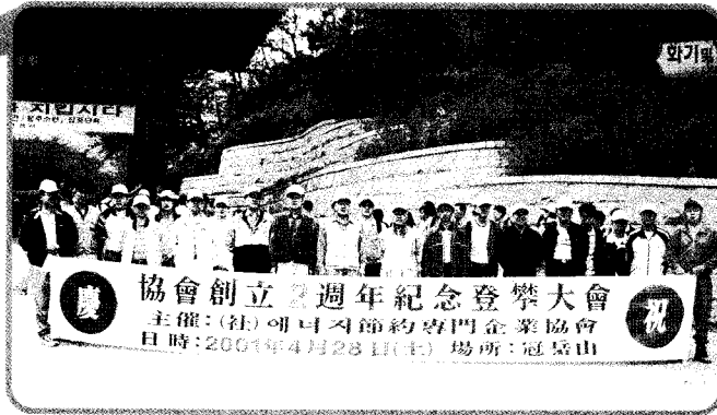
○ 등반에 앞서 참석자들이 기념촬영한컷 협회 창립 2주년을 기념하기 위해 30여명의 ESCO인들이 모였다.