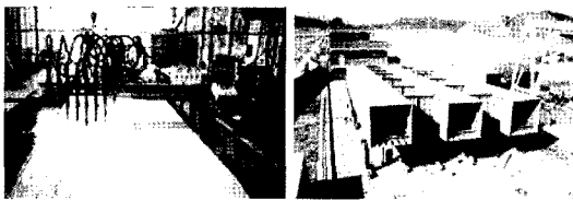
〈그림 2〉 실내 제작 작업 광경 및 가조립 검사 광경

한국중공업의 실내 제작장에서 강제절단, 보강 리브 용접, 다아아프랩 설치, 도장, 가조립 등의 과정을 거쳐 제작된 후 소래대교 현장으로 운반되어 CRANE으로 가설 조립하였다.