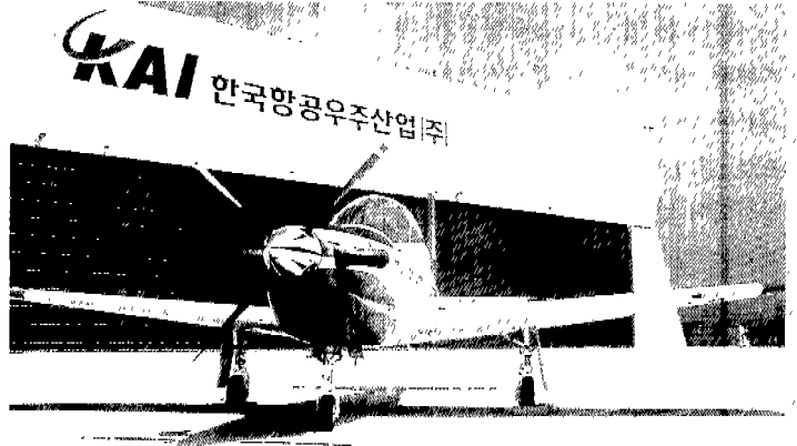
2000년도 항공우주기술개발사업으로 KT-1 훈련기의 기총장착과 항공전자시스템 및 운영기술 개발이 추진되고 있다.

한국항공우주연구원의 항공기 부품개발사업 추진전략 수립, 산업연구원의 국가 항공우주연구개발체제 개선방향 연구기획 사업도 진행중이다. 항공기 부품개발사업 추진전략 수립의 연구기획사업은 국내 항공기 산업의 발전전략 검토, 항공기 부품기술개발 타당성 조사, 항공기 분야 기술예측 및 기술이정표 수립, 부품개발 종합계획 수립, 민군겸용기술에 대한 정책대안 도출, 국내외 민간항공기 수요 전망을 주연구내용으로 수행해 항공우주기술개발사업의 추진방향을 제시하게 될 것이며 기술개발사업 품목발굴 및 수요자와 공급자를 연계하는 등으로 향후 건전한 항공산업 육성방안을 제시할 것이다.