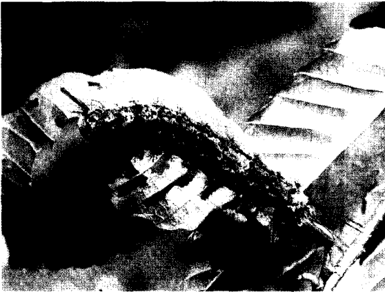
〈그림 4〉 붉은매미나방 성충

나무, 떡갈나무 등 참나무과 수종과 벗나무, 배나무, 사과나무 등 장미과 식물, 기타활엽수 다수