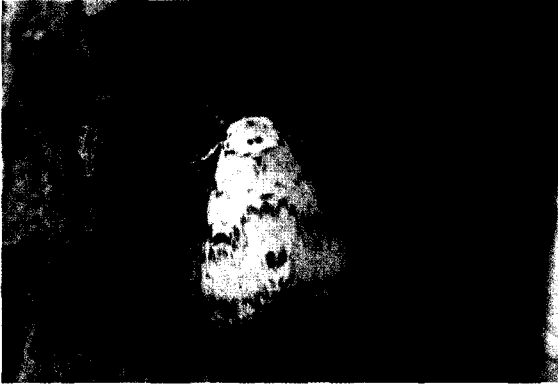
〈그림 3〉 붉은매미나방 유충