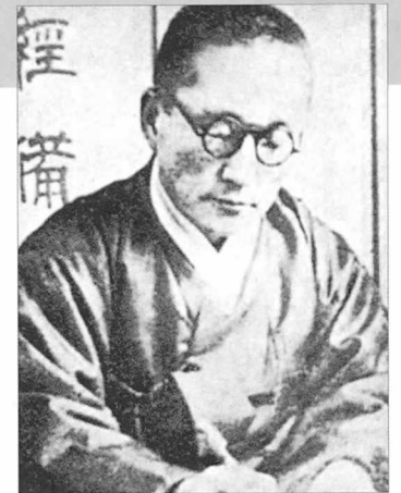
천재들은 삶의 양극단을 오가는 일이 비일비재하다. 태산처럼 우뚝 솟은 봉우리가 됐다가도 심연으로 추락하고, 어느 날 갑자기 그 나락을 박차고 오르기도 한다. 사진은 한 시대를 풍미했던 천재들. 위에서 시계방향으로 나폴레옹, 도스토예프스키, 이광수.

다른 세력들에게 모든 책임을 전가하려 들고 자신을 이해하지 못한다며 분개하기도 한다. 그리고 그들은 자신의 욕구에 들어맞는 자기 합리화에 나선다. 대중의 공감을 얻지 못할 때도, 그들은 춘원처럼 자신을 십자가를 진 순교자의 위치로 격상시킨다. 결국 자신은 매우 신성하고 순수한 존재가 된다. 그들의 높은 이상을 충족시키는 데는 신성한 존재가 되는 것보다 더 좋은 것은 없을 것이다. 그러나 분명한 진실은 신과 인간이 공존한 역사적 예가 없다는 것이다. 천재들이여, 이제 그만 좀 하자! ●