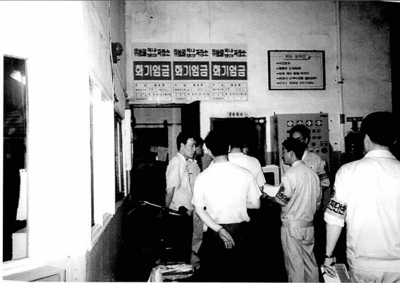
▲ 안전보건 감사제도 노·사합동점검(매분기별)