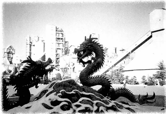
쌍용양회공업(주) 영월공장 전경

각 안전분임조별로 현장의 안전관리 문제점을 토의 후 대책을 수립하고, 현장의 위험요인·안전정보·기타 사항에 대해 토의식으로 문제 해결방안을 도출함으로써 자연스런 안전교육과 전 직원을 안전교육에 동참시킴으로써 교