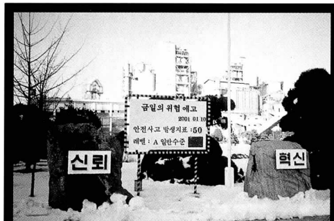
▲ 금일의 위험예고게시판