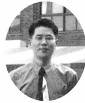
글 · 박옥룡 | 삼성서울병원 인사팀 교육과 과장

기본 인성을 갖춘 의료인상 확립을 위한 삼성서울병원(이하 “SMC”) 업(MISSION)의 개념을 실현하기 위해 SMC 추진전략 및 새 전통 수립 사항에 대한 실천의지를 함양하고, 친절마인드 제고 및 의식구조 개선을 위한 각종 활동이 병원 개원 이후 현재까지 전 직원의 지속적 관심 속에 지속되어 왔다.