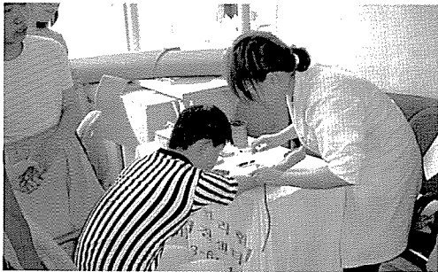
▲ 부산지부는 소년기술훈련원, 남광아동복지원, 천마재활원, 선아원, 장애인복지관 등 원생 350여명에게 무료 건강검진을 실시했다.