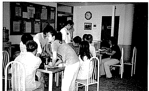
▲ 제주지부는 제주시립 희망원·정신요양원, 도내 초등학교 대상 트론티 건강캠프 등 원생 및 캠프 참여 학생 350여명에게 무료 건강검진을 실시했다.