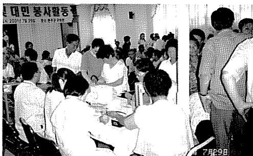
▲ 전북지부는 전주평화사회복지관, 완주군 구이면 구이농협회관 등 모자보호시설 원생 및 벽·오지 주민 470여명에게 무료 건강검진을 실시했다.