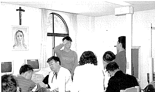
▲ 강원도지부는 춘천밀알재활원을 방문하여 원생 50여명에게 심장질환검사, 혈액질환검사, 고지혈증검사 등 10개 종목 25여 항목에 대해 무료 건강검진을 실시했다.