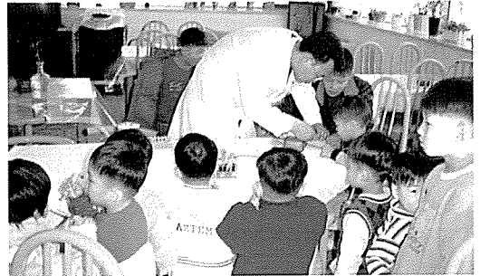
▲ 부산지부는 새들원, 우리집원, 박애원, 은혜의 집 등 13여 곳의 이동복지시설 및 장애인복지시설을 방문하여 총700여명의 원생에게 기초검사, 혈액질환검사, B형간염검사, 요화학검사 등 총 12종목 30여 항목에 대해 무료건강검진을 실시했다.