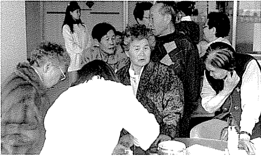
▲ 충북지부는 산남종합사회복지관을 방문하여 원생 40여명에게 간기능검사, 심장질환검사 흉부X레이검사 등 11개 종목 25여 항목에 대해 무료 건강검진 및 건강상담을 실시했다.

한국건강관리협회는 지난 1월 한 달 동안 아동복지시설, 장애인복지시설 등을 방문하여 2,000여명에게 건강상담과 건강 검진을 실시하여 지친 몸에 활력을, 상처입은 마음에 송이를 불어넣어 주는 작은사랑을 실천하였습니다.