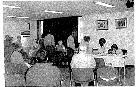
▲ 경기도지부는 낙원의 집, 팔달산 사랑의 집, 수원노인복지회관 등 사회복지시설 및 노인복지시설 등 7개 기관을 방문하여 원생 300여명에게 기본검사, 고지혈증검사, 당뇨검사 등 8개 종목 20여 항목에 대해 무료 건강검진 및 건강상담을 실시했다.