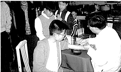
▲ 대구지부는 호호어린이집, 성림원, 신애보육원 등 아동복지시설 5여 곳을 방문하여 원생 총 220여명에게 기초검사, 당뇨검사, 흉부X레이 등 11종목 25여 항목에 대해 무료 건강검진을 실시했다.