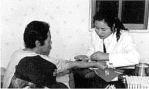
▲ 대전·충남지부는 사회복지시설인 뽕엘의 집을 방문하여 원생 70여명에게 소변검사, 심장질환검사, 혈액질환검사 등 9개 종목 20여 항목의 무료 건강검진 및 건강상담을 실시했다. 또한 보호간기어대상자 20여 명에게도 건강가족 무료검진을 실시했다.