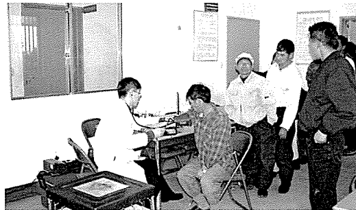
▲ 제주지부는 노숙자 시설인 서귀포시립사랑원을 방문하여 원생 40여명에게 기초검사 및 간기능검사, 당뇨검사, 고지혈증검사, 심장질환검사 등 8개 종목 15여 항목에 대해 무료 건강검진 및 건강상담을 실시했다.