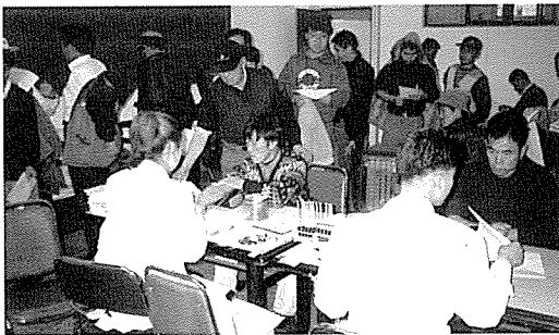
▲ 서울지부는 지부 검진센터에서 강서구청 사회복지과의 협조를 얻어 저소득층 주민 200여명에게 무료 건강상담 및 건강검진을 실시했다.

어느새 찾아온 봄. 시작은 언제나 분주하고 설레는 일이지만 모두들 새로운 각오로 자신의 주변을 정돈하고 다듬는 좋은 기회이기도 합니다. 새해를 시작하기도 어느덧 2개월이 지났습니다. 그동안 계획했던 일이 제대로 이루어지고 있는지 한번 돌아보면 좋을 듯합니다. 이루지 못했다면 여유를 갖고 새봄과 함께 새롭게 시작할 수 있을테니까요……. 한국건강관리협회도 이웃을 위해 열심히 봉사하겠다는 새해의 첫마음을 그대로 지키고 있는지 생각해 보겠습니다. 늘 바쁜 일상이지만, 따사로운 봄볕과 함께 모두가 빙그레 미소질 수 있는 사랑의 현장을 만들어 나가기 위해서…….