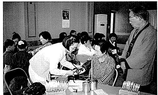
▲ 제주지부는 지난 5월 화북동노인회, 제주보육원, 제주소녀원, 새서귀초등학교 외 30개교 등 원생 및 중식지원 학생 340여명에게 무료 건강검진을 실시했다.

이외에도 서울, 부산, 울산, 경기, 충북, 대전충남, 광주전남, 경북, 경남지부 등이 장애인, 사회복지시설 수용자 등을 대상으로 각각 무료 검진을 실시했다.