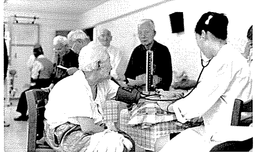
▲ 강원지부는 지난 5월 춘천사랑의 집, 보육시설 등 원생 및 중식지원학생 370여명에게 무료 건강검진을 실시했다.

이 세상에서 가장 아름다운 만남 이것은 사랑으로 맺어진 봉사와 희생이 아닐까 생각합니다. 모르는 이를 위해 아무 대가를 바라지 않고 술선수법하며 봉사하며 희생 할 수 있다는 것. 누구나 할 수 있는 일인 듯 하지만 어려운 일. 그렇지만 하고 나면 봉사와 희생은 가장 아름다운 기억으로 남게 됩니다. 한국건강관리협회는 봉사와 희생을 실천하고 있습니다. 지난 5월 한달 동안에도 9천여명에게 무료 건강검진과 건강상담을 실시하여 아름다운 만남을 실천하였습니다.