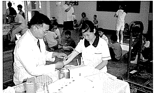
▲ 전북지부는 지난 5월 삼성보육원 등 원생 및 지역 주민 400여명을 대상으로 무료 건강검진을 실시했다.