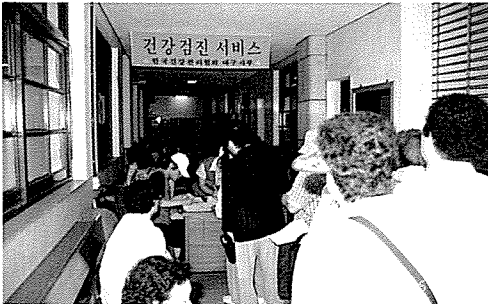
▲ 대구지부는 지난 5월 청곡종합사회복지관 등 15개 시설, 동촌중학교 외 9개교, 무열대유치원 등 원생 및 중식지원 학생 479여명을 대상으로 무료건강검진 및 순회진료를 실시했다.