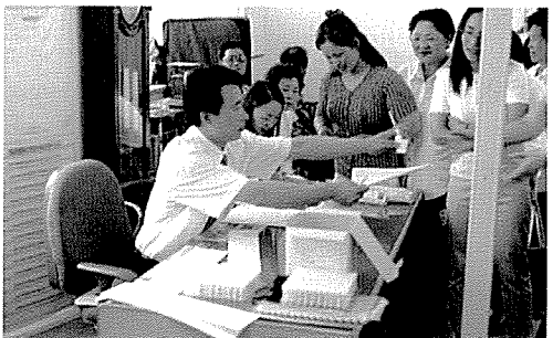
▲ 울산지부는 울산보훈지청, 장생포초등학교 등 시민 및 중식지원 학생 70여명을 대상으로 무료 건강검진을 실시했다.