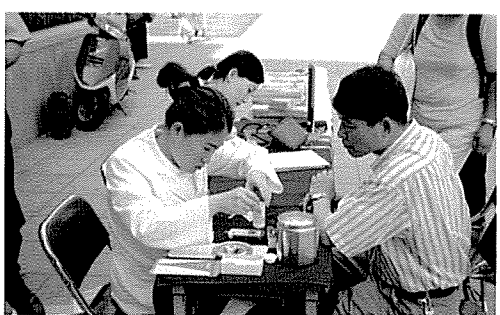
▲ 인천지부는 신세계백화점, 검단초등학교 외 74개교 등 시민 및 중식지원 학생 1,200여명에게 무료 건강검진을 실시했다.