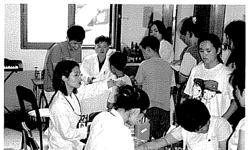
▲ 전북지부는 전북 보성원, 전주 자람원, 전주시 지역 주민검사 등 원생 및 지역주민 250여명을 대상으로 무료 건강검진을 실시했다.