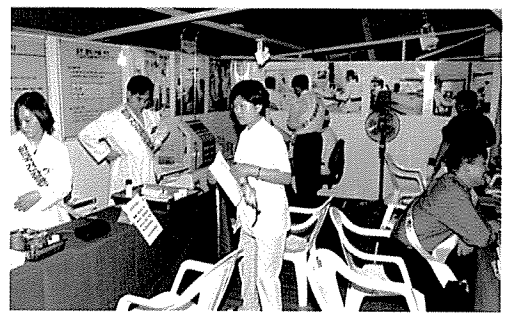
▲ 충북지부는 단양군 건강박람회, 충주종합복지관 외 2개 시설, 용암초등학교 외 2개교 등 도민 및 원생 그리고 중식지원 학생 640여명을 대상으로 무료 건강검진을 실시했다.