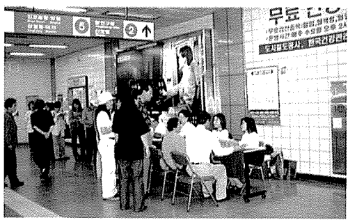
▲ 서울지부는 화곡·까치산 전철역 이용시민, 봉천초등학교, 노량진초등학교생 등 시민 및 중식지원 학생 1,100여명을 대상으로 무료 건강검진을 실시했다.

한국건강관리협회는 모든 분들의 건강을 위해 봉사와 희생의 정신으로 일하고 있습니다. 지난 6월 한달 동안에도 1만 2천여명에게 무료 건강검진과 건강상담을 실시하여 아름다운 만남을 실천하였습니다.