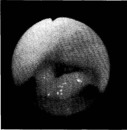
Fig. 2A. Vocal cords showed inspiratory adduction at bronchoscopy.