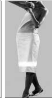
<그림 6> 미니멀 패션 스타일 자극물('99 S/S 제시) : bare top.