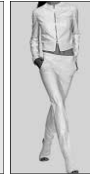
<그림 8> 미니멀 패션 스타일 자극물('00 S/S 제시) : 미래적 소재로 된 미니멀 스타일.