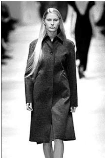
<그림 1> 미니멀리즘 패션의 예: '98 F/W 질 샌더(Jil Sander) 프레타포르테 컬렉션(www.fashiontalk.com).

한편, 맥시멀리즘(Maximalism)이란 미니멀리즘의 반대되는 개념으로써, 인간의 근원적 감성에 충실하고 과거와 전통에 대한 관심이 다양한 양식으로 나타나