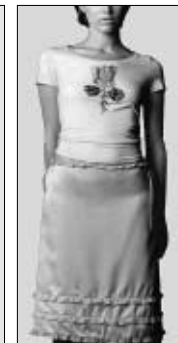
<그림 13> 맥시멀 패션 스타일 자극물('00 S/S 제시) : 프릴이 달린 여성적인 스커트.