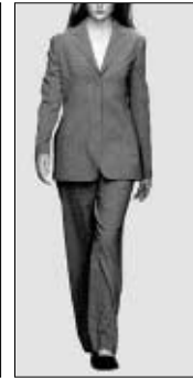
<그림 5> 미니멀 패션 스타일 자극물('99 S/S 제시) : 회색 바지 정장.