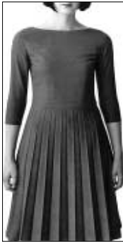
<그림 3> 미니멀 패션 스타일 자극물('98 F/W 제시) : 규칙적인 주름 스커트, 원피스.