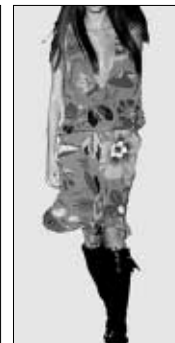
<그림 11> 맥시멀 패션 스타일 자극물('99 S/S 제시) : 이국적인 꽃무늬 패턴.