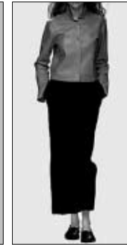
<그림 7> 미니멀 패션 스타일 자극물('99 F/W 제시) : lean & long silhouette.