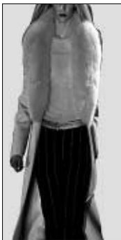
<그림 9> 맥시멀 패션 스타일 자극물('98 F/W 제시) : fur trimming이 있는 재킷, 코트.