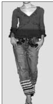
<그림 10> 맥시멀 패션 스타일 자극물('99 S/S 제시) : 장식적인 청바지.