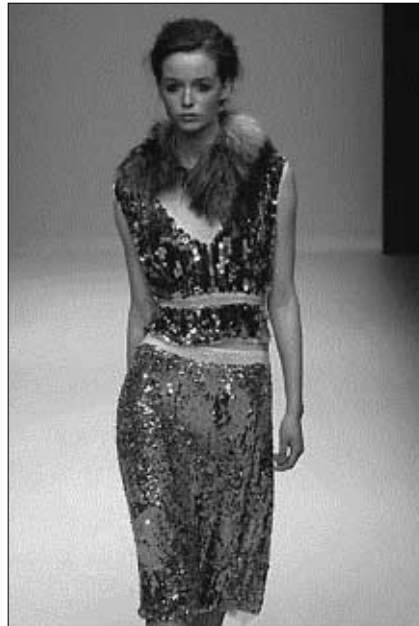
<그림 2> 맥시멀리즘 패션의 예: '00 F/W 프라다(Prada) 프레타포르테 컬렉션(www.firstview.com).