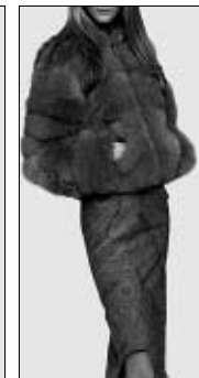
<그림 12> 맥시멀 패션 스타일 자극물('99 F/W의 제시) : 모피 코트.