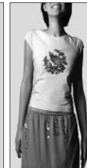
<그림 14> 맥시멀 패션 스타일 자극물('00 S/S 제시) : 자수나 비즈 등의 수공예적인 장식.

조사방법 및 조사대상 : 본 연구의 목적에 따라 패션 트렌드에 민감하고 소비력이 있는 19세부터 90년대 중반 이후 새로운 소비군과 패션 리더 층을 형성하고 있는 30대 후반(섬유저널 1999 1월; 섬유저널 1995 3월) 여성으로 조사대상을 제한하였다. 미니멀 패션 스타일 선호자 145명과 맥시멀 패션 스타일 선호자 72명 등 총 217명이 본 연구의 조사대상자로서 임의 표집되었다. 본 조사에 앞서 예비조사를 실시한 결과를 토대로 자극물과 설문지를 수정 보완하였으며, 2000년 7월~8월에 걸쳐 본 조사를 실시하였고 불성