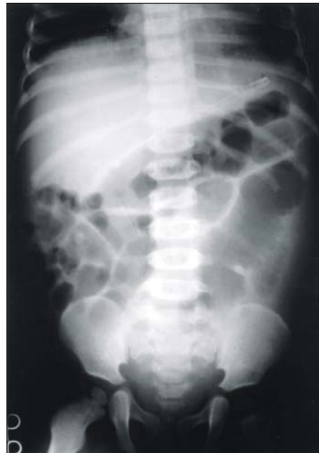
Fig. 2. Simple abdominal X-ray reveals dilated bowel loops.

검사 소견: 입원 당시 시행한 혈액검사에서 백혈구 15,560/mm 3 (중성구 72.6%, 림프구 15.9%, 단핵구 3.6%, 호산성구 7.6%, 호염기성구 0.3%), 혈색소 9.2 g/dL, 혈소판 370,000/mm 3 였고, 동맥혈 가스분석에서 pH 7.469, PCO 2 29.8 mmHg, PO 2 89.6 mmHg, base excess -1.2 mmol/L, HCO 3 21.4 mmol/L, SaO 2 97.4%였으며, 전해질 검사상 혈청 Na + 129 mEq/L, K + 3.5 mEq/L, Cl - 93 mEq/L, Cr 0.3 mg/dl 이었다. 요검사 및 간기능 검사는 정상이었고, CRP는 4.57