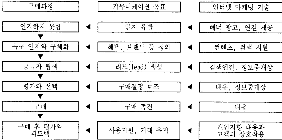
〈그림 II - 2〉 新規 顧客의 購買에 影響을 미치는 인터넷 方法