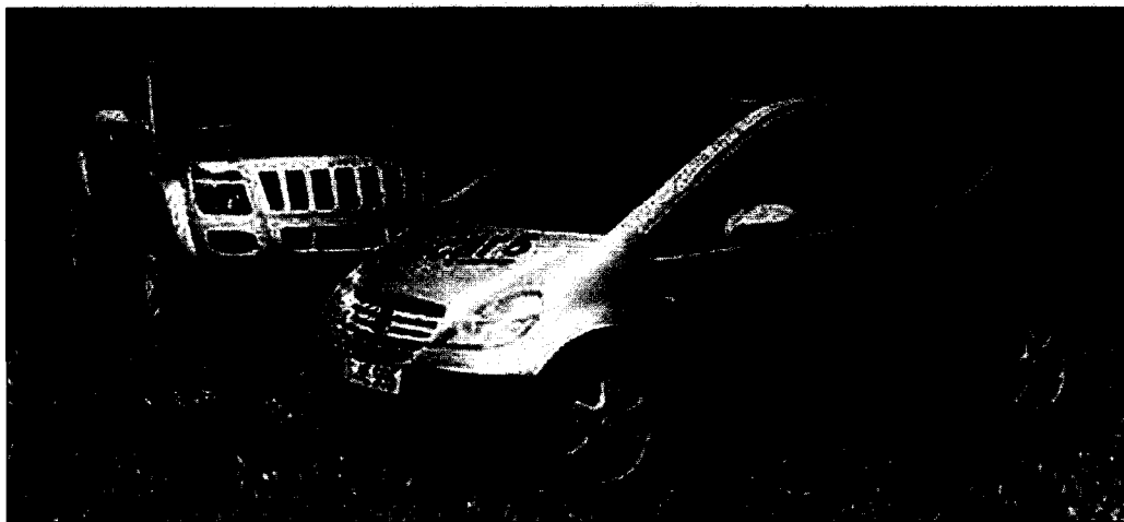
<그림 3> 2000년 11월 새로 공개한 메타놀 연료전지자동차

리에서 DaimlerChrysler사의 회장인 Jurgen E Schrempp씨가 <그림 3>의 Nekar5와 Jeep Commander 2 두 종류의 연료전지자동차를 새로 공개하였다.