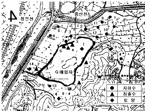
Fig 1. Topograph of G-Landfill

조사 대상인 매립장은 G 지역에 위치하고 있으며, 사용기간은 1983년부터 1999년 6월까지 사용된 61,000㎡ 규모의 비위생 매립장으로 2000년부터 2002년까지 정비가 계획되어 실시되고 있다. 매립지 정비의 일환으로서 본 연구가 실시가 되었고, 오염도 평가를 위한 시료채취는 매립장 및 그 주변 토양, 지하수 그리고 침출수를 조사대상으로 하였다. 조사지역은 Fig.1과 같으며 매립장 주변은 주로 논과 밭으로 둘러 쌓여 있고, 2개의 하천이 매립지 가까이에 위치해 있으며, 주택가와 아파트 단지 인근에 위치해 있