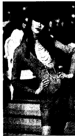
<그림 8> Christian Dior Haute Couture Collection(1997)