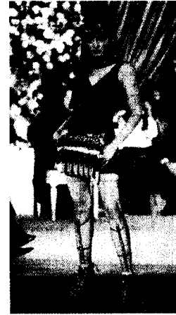
<그림 6> Christian Dior Haute Couture Collection(1997)