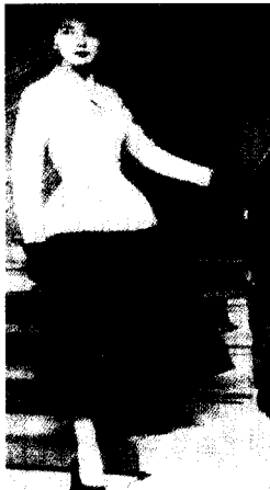
<그림 4> Keenan(1991), p.30