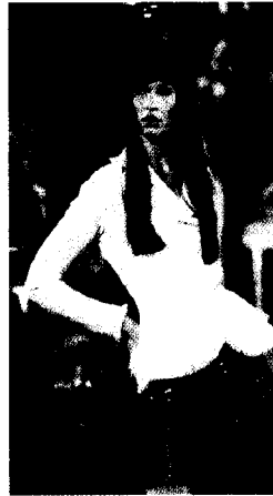
<그림 5> Christian Dior Haute Couture Collection(1997)