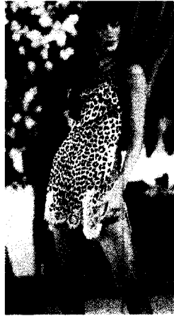
<그림 2> Christian Dior Haute Couture Collection (1997)