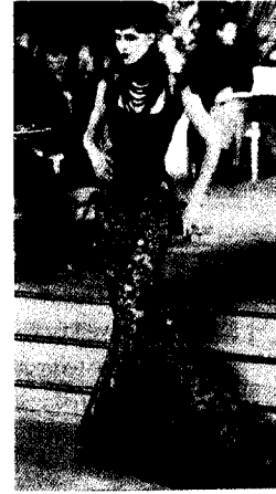
<그림 3> Christian Dior Haute Couture Collection (1997)