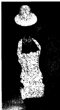
<그림 7> Christian Dior Haute Couture Collection(1997)