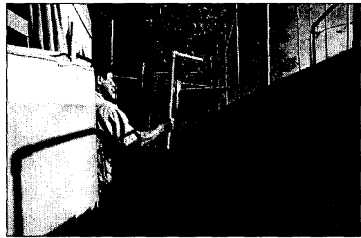
그림 1. 수동펌프

파이프형 수동펌프의 구성은 그림 2와 같이 'ㄱ'로 형성된 파이프의 후단부 내면에 들어갈 수 있는 철제용 파이프를 고정시키고, 철제용 파이프의 상부에는 파이프를 막을 수 있는 크기의 볼을 집어넣었으며, 물이 올라올 때 볼을 제한된 공간에 머물도록 하기 위하여 일정 간격을 두어 스톱퍼를 설치하였다.