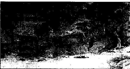
그림 5. 녹채 주변 경관

출처: 南琦 作, 臨王維綱川圖, (298×468.1cm) 絹本著色 部分, 王維(1985) 文人畫粹編 - 中國篇, 東京: 中央公論社, p. 22.