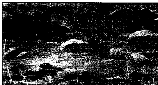
그림 4. 근죽령 일대 경관

출처: 南琦 作, 臨王維綱川圖, (28×483.1cm) 絹本著色 部分, 王維(1985) 文人畫粹編 - 中國篇, 東京: 中央公論社, p. 36.