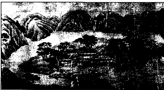
그림 3. 망천 일대 경관

출처: 唐逮 作, 至正 2年(1342) (348×509.1cm), 絹本著色, 王維(1985) 文人畫粹編 - 中國篇, 東京: 中央公論社, pp. 25-27.