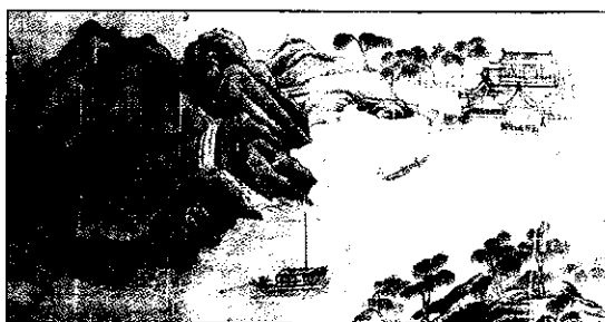
그림 6. 의호 일대 경관

출처: 唐逮 作, 至正 2年(1342), 臨王維綱川圖 (348×509cm) 絹本著色 部分, 王維(1985) 文人畫粹編 - 中國篇, 東京: 中央公論社, p. 23.