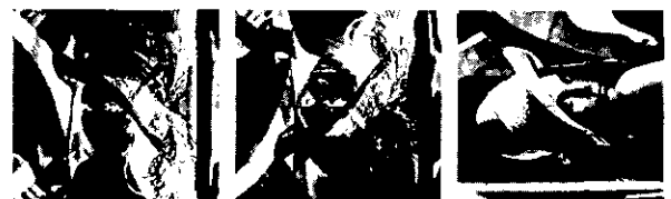
(그림 6) ICA에 의해 분류된 영상