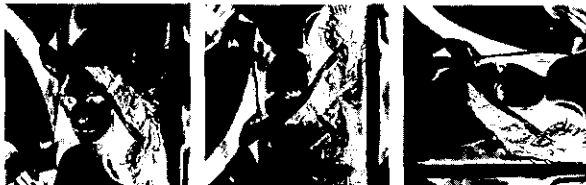
(그림 9) 잡음[N(0, 0.75)]를 주었을 때의 정규화 전처리를 통한 ICA에 의해 분류된 영상

아래의 <표 3>과 <표 4>는 각각 인근평균 및 정규화 두 가지 전처리를 통한 ICA에서 잡음에 따른 대한 영상 분류를 나타낸다. <표 3>과 <표 4>에서 OR는 원영상, H 1 , H 2 , H 3 는 형태를 변형시킨 원영상((그림 3) 참조), S 1 , S 2 , S 3 는 ICA에 의해 분류된 영상을, 측정값은 ICA에 의해 분류된 영상과 형태를 변형시킨 원영상간의 LSE값을 나타낸 것이다. <표 3>에서, N(0, 0)일 때, H 3 와 S 1 과의 LSE값은 3.3617 e^{+004} 이고, H 2 와 S 2 와의 LSE값은 3.3602 e^{+004} 이며, H 1 과 S 3 와의 LSE값은 3.3569 e^{+004} 이므로 영상 분류가 됨을 알 수 있다. 계속해서 분산을 변화시켜 LSE값을 구하여 영상 분류를 알 수 있다. 그러나, N(0, 0.67)인 경우 H 2 와 S 1 과의 LSE값은 3.3608 e^{+004} 이고, H 3 와 S 2 와의 LSE값은 3.3610 e^{+004} 이며, H 2 과 S 3 와의 LSE값은 3.3516 e^{+004} 이므로 S 1 와 S 3 는 H 2 에 중복되어 정합이 되므로 N(0, 0.67)에서는 영상 분류가 되지 않았고, 그 이상에 대하여는 분류가 되지 않았다(<표 3> 참조). 따라서, 인근 평균 전처리를 통한 잡음에 대한 강인성은 모의 실험 결과 N(0, 0.66)에서 볼 수 있다. 그러나, 영상의 화소의 집합이 크기 때문에 다음에 언급되는 정규화 전처리에 비해 평활화 효과는 증대하나 반면에 영상의 선명도가 흐려짐을 (그림 8)에서 볼 수가 있다. <표 4>에서도 동일한 방법으로 LSE값을 구하여 영상 분류를 알 수 있다. N(0, 0.76)인 경우 H 2 와 S 1 과의 LSE값은 3.3509 e^{+004} 이고, H 2 와 S 2 와의 LSE값은 3.3595 e^{+004} 이며, H 1 과 S 3 의 LSE값은 3.3517 e^{+004} 이므로 S 1 과 S 2 는 H 2 에 중복되어 정합이 되므로 N(0, 0.76)에서는