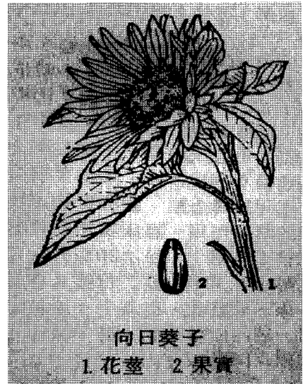
그림 2 向日葵<中藥大辭典>

해바라기를 한문으로는 向日葵, 向日花, 向陽花, 朝陽花, 太陽花 등으로 표기하고 있는데, 2) 이는 해(日)를 향(向)하는 아욱(葵)이나 닥풀(黃蜀葵)의 꽃(花)과 비슷하다는 뜻으로 지어진 단어이다. 해바라기란 한글의 의미도 ‘해(日)를 바라는(向) 식물(기)’이라는 뜻으로 向日葵 또는 向日花를 우리말로 번역한 언어기호로 볼 수 있다. 3) 또한 영어로도 해(sun)와 같은 꽃(flower)이라는 뜻으로 sunflower라 하니 동서양이 해바라기의 품성에 대하여서는 비슷한 인식을 하였다.