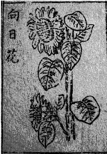
그림 1 向日花<字典釋要>

지석영(池錫永, 1855~1935)은 『字典釋要』(1909)에서 규(葵)를 설명하는데 있어서 아욱의 뜻과 해바라기(向日花)의 의미가 같이 있다고 하였다. 4) 여기에 나오는 해바라기는 지금의 해바라기와 동일한 것으로 보아야 한다. 왜냐하면 『字典釋要』의 부록에 나오는 그림을 통하여 한눈에 지금의 해바라기임을 알 수 있기 때문이다.(그림 1 참조) 현재 중국에서도 向日葵를 해바라기로 보고 있다(그림 2 참조).