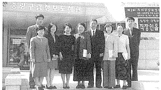
<중랑구립정보도서관을 방문한 중국대표단>

이 번 중국도서관학회 대표단의 방한은 양국 도서관협회의 상호초청계획에 따른 것으로, 지난 7월 17일 내몽고자치구 하이라(Hailar)시에서 열린 중국의 제2회 전국도서관대회에는 우리 협회 대표단이 참석한 바 있다.