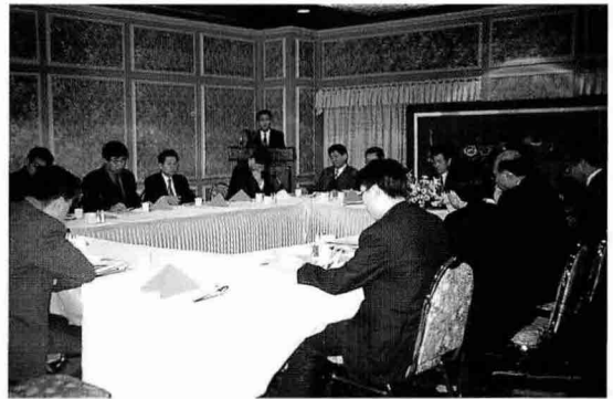
◆ 1월 상임이사회