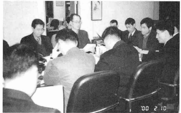
◆ 2. 10. ITS 위원회의