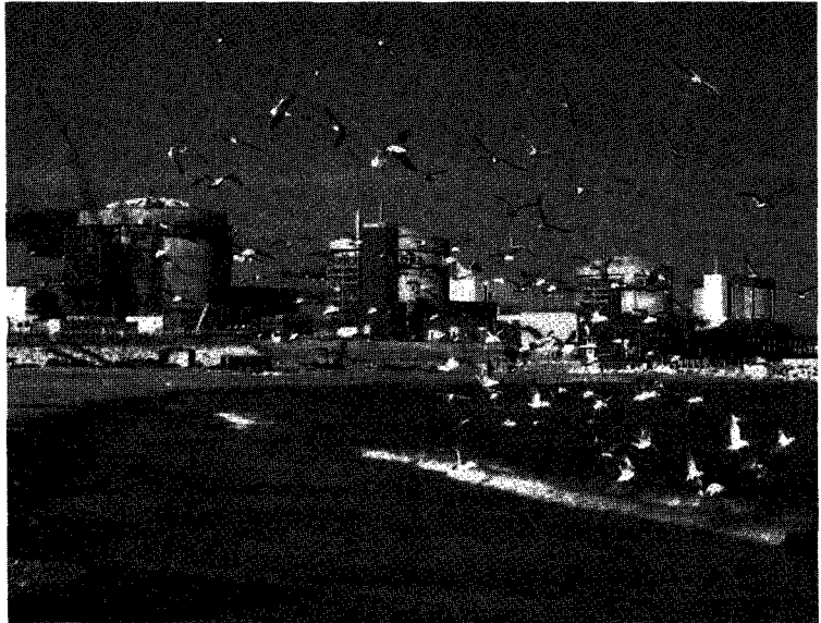
월성 1~4호기. AECL은 CANDU 원자로 소유자와 함께 작업을 하면서 보다 포괄적이며 통합된 CANDU 발전소 수명 관리 프로그램(Plant Life Management Program :PLiM)을 개발하고 이를 구현하기 위한 노력을 기울여왔다.

동중인 발전소와 미래의 발전소에 대한 수명 관리 프로그램을 개발하기 위한 작업을 진행하고 있다.