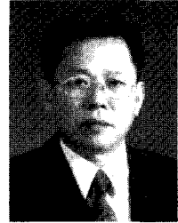
[번역 : 임 병 순]

『이 글은 일본 “Dairy Japan”사의 21세기 낙농, 키-워드 130, 사양, 관리, 영양 편에서 필요한 내용을 발췌하여 소개합니다』 과거자료이기 때문에 내용상 이의가 있을 수 있음을 양해하여 주시기 바랍니다.