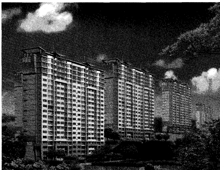
이제 아파트도 패션시대. 아파트 외벽부터 스타일이 전혀 다른 신축전 삼성래미안.