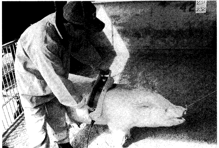
▲종돈 능력 검정 모습(본회 1검정부, 등지방 측정)

한국에서 지난 2년여 동안 목격한 사실은, 육종전문가들이 너, 나 할 것 없이 각종 최신 통계기법을 연구하고 능력검정자료 분석에 경주하고 있는 것이었다. 문제는 분석할 검정자료의 구조분석은 동한시하고, 무작정 최신 통계처리법을 아무 자료에다가 적용하는 무리를 범