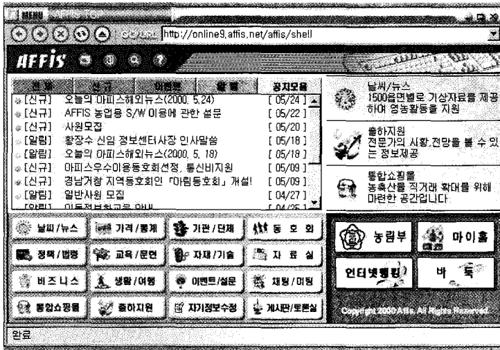
▲ 농림수산정보센터 인터넷 홈페이지