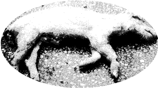
▲살모넬라 증세로 여윈 돼지

살모넬라의 발병 시기는 여름철에 육성, 비육돈에서 다발 하는 것으로 알려졌는데 요즘은 비육초기에 발병하여 양돈농가들에게 피해를 주고 있다.