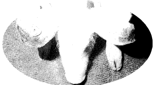
▲귀부분과 주둥이에 피부변색이 일어난 돼지